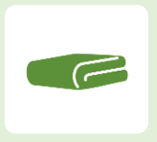
フェイスタオル バスタオル