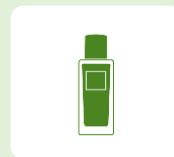
化粧水 & 美容液 ジェル