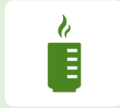
煎茶・ほうじ茶 梅ごぶ茶