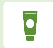
メイク落とし & 洗顔ジェル